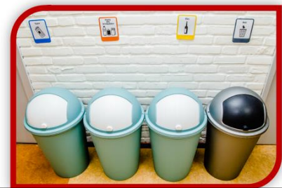
Uit rapportage van afval naar grondstof, april 2020

Om het goede voorbeeld te geven in een wijk waar niet iedereen even netjes omgaat met zijn afval, is er op Allekanten extra aandacht voor het goed scheiden van afval. Op de locatie staan de vuilnisbakken met instructie wat in welke bak moet. Ook is er afvalvoorzichting in combinatie met Nederlandse taalles. Het project slaat aan en een aantal deelnemers scheidt nu thuis GFT. Dit is een goede voorbereiding op het werkfittraject van afval naar grondstof wat vanuit Allekanten van start moet gaan.